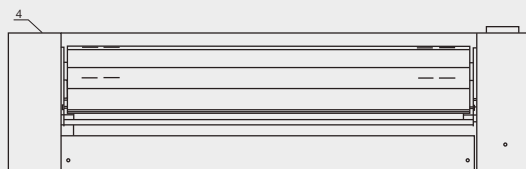
SHORA I 25 30