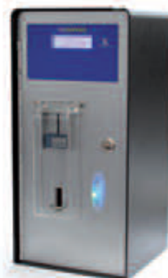
Verze s 1 programem