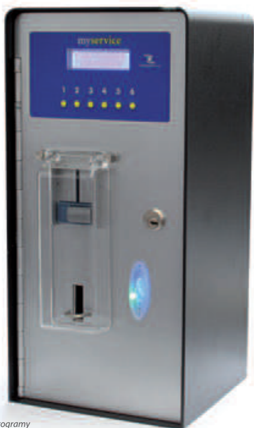
Verze s 6 programy

MyService, je nový typ platebního terminálu, který dokáže spravovat až 6 různých programů nebo služeb. Díky bezhotovostnímu systému EuroKey Next a mincovníku mincí RM5 HD zaručuje MyService bezpečnost, flexibilitu a inovaci. Může nejen automatizovat platby za několik časových služeb, jako jsou služby v oblasti samoobslužných prádelen, sportovních a turistických zařízení, veřejných služeb a časovaného osvětlení, ale může také spravovat různé prodejní a identifikační aplikace a ukládat je do jednoho RFID úložiště (karta, klíč nebo přívěšek). Je k dispozici také s bezhotovostním systémem WorldKey pro pokročilé řízení účetnictví a vzdálenou správu a aktualizaci dat pomocí ethernetového připojení.