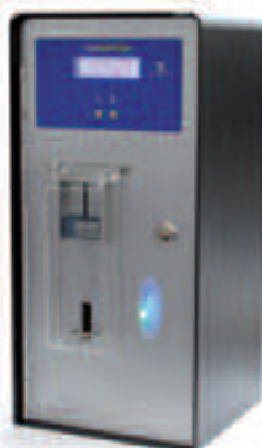
Verze s 2 programy